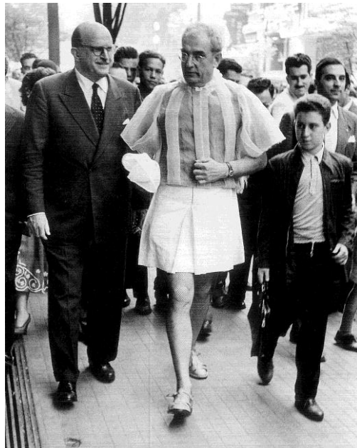
Flavio na rua com traje New Look . São Paulo, 1956

Arquiteto e artista plástico, Flavio de Carvalho foi uma das personalidades mais interessantes que viveram em São Paulo entre as décadas de 1930 e 1970.