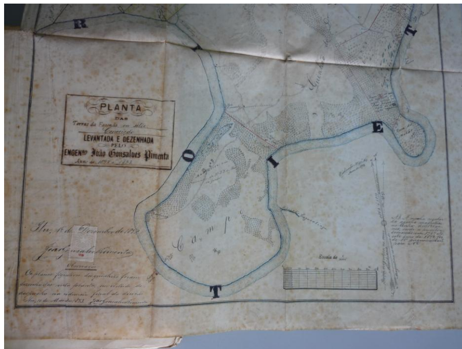
Detalhe da planta elaborada pelo Engenheiro João Gonsalves Pimenta, onde se vê a capela.