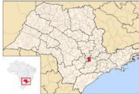
Visualização da capela em relação ao Estado de São Paulo, e à esquerda, em relação ao País.