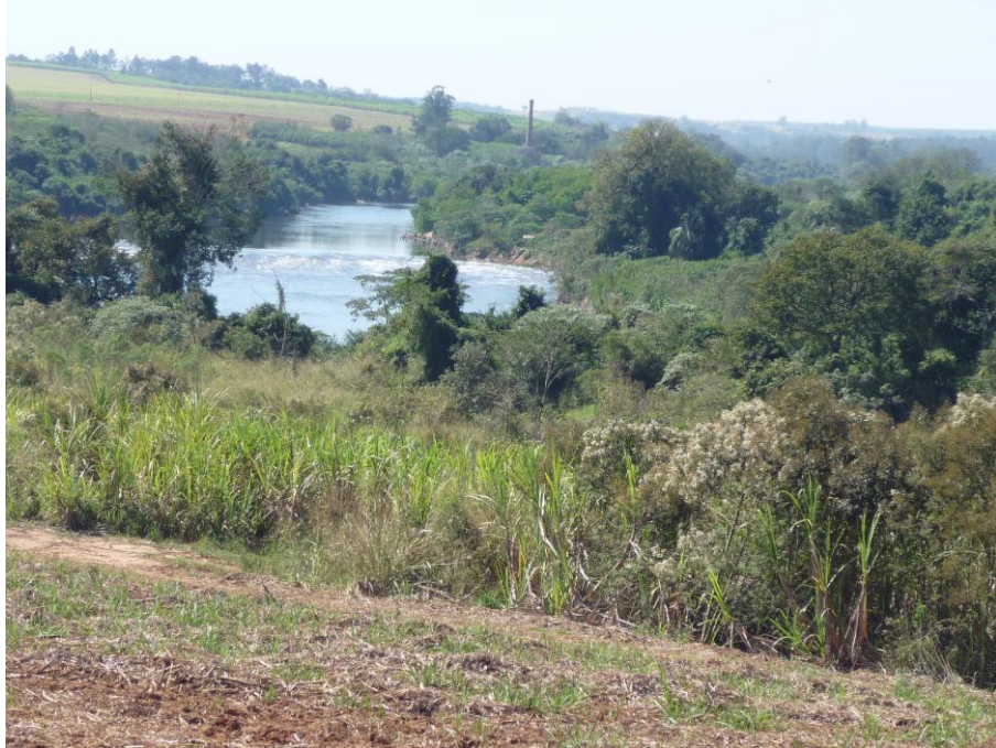
Corredeiras do rio Tietê, vistas das proximidades da antiga capela, em fotografia tirada pelo autor.