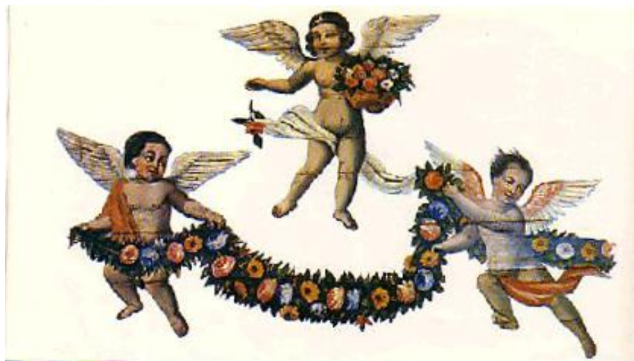
Pintura de Jesuíno do Monte Carmelo, no teto da Igreja do Carmo de Itu, SP, onde aparece um anjo negro, que na época da escravidão poderia ser tido como acinte, mas que queria afirmar corajosamente que os negros também alcançariam o céu.

Nota 23: Nas duas fotos antigas que temos da Matriz de Itu, em épocas diferentes, aparece, lateralmente a ela, do outro lado da rua do Carmo, que hoje se chama Barão de Itaim, o palacete dos Pereira Mendes, antigo solar da Baronesa de Piracicaba (viúva do Brigadeiro Luiz Antônio que deu seu nome à famosa avenida da capital paulista). A altura deste palacete serve de padrão para se comparar a altura da Igreja antes e depois da reforma em pauta, pois o casarão não foi modificado nesse passar de um século. Se medirmos, nas fotos, as alturas dos dois edifícios, antes e depois da reforma de 1888/89, a relação entre elas fica praticamente constante.