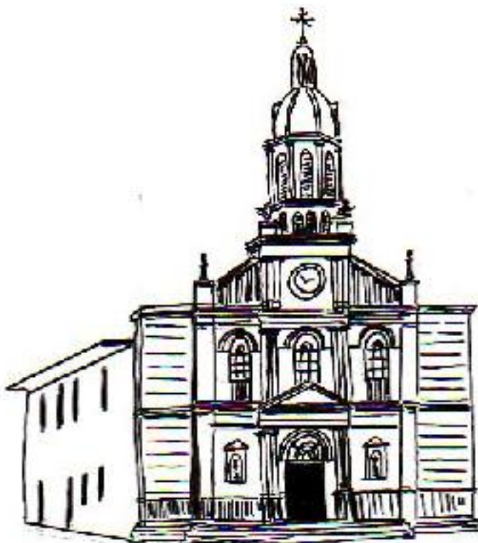
Igreja Matriz de Nossa Senhora da Candelária de Itu Traçado da fachada após a reforma de 1888/89