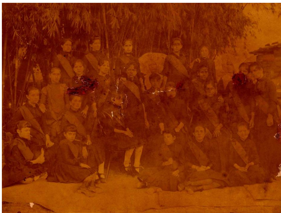
Alunas do Colégio Imaculada Conceição.

Em meio a seus livros didáticos um deles era a “Pequena História Sagrada da Infância”.