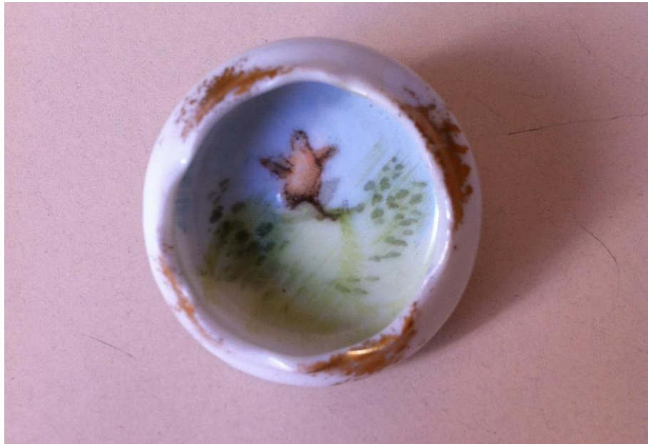
Vasilha para pinturas em aquarela. Acervo Família Weber