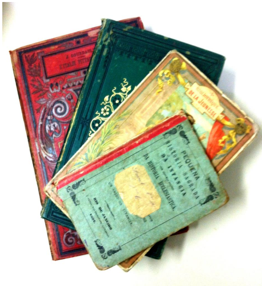
Livros obtidos por prêmio.