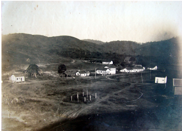
Foto 1. Vista do Distrito de Santa Rita do Prata, Varre-Sai - RJ, por volta de 1920.